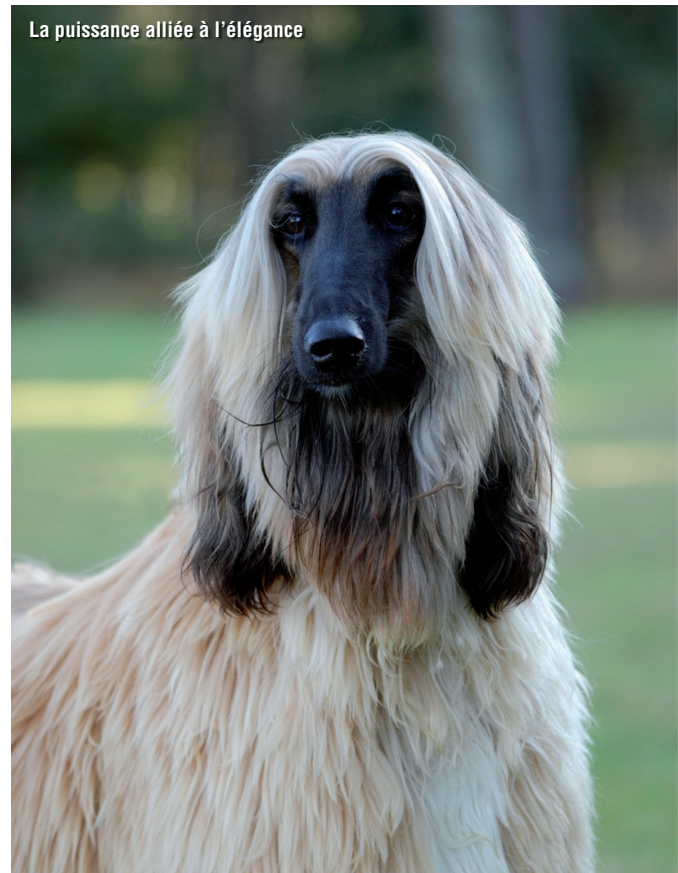
La puissance alliée à l'élégance