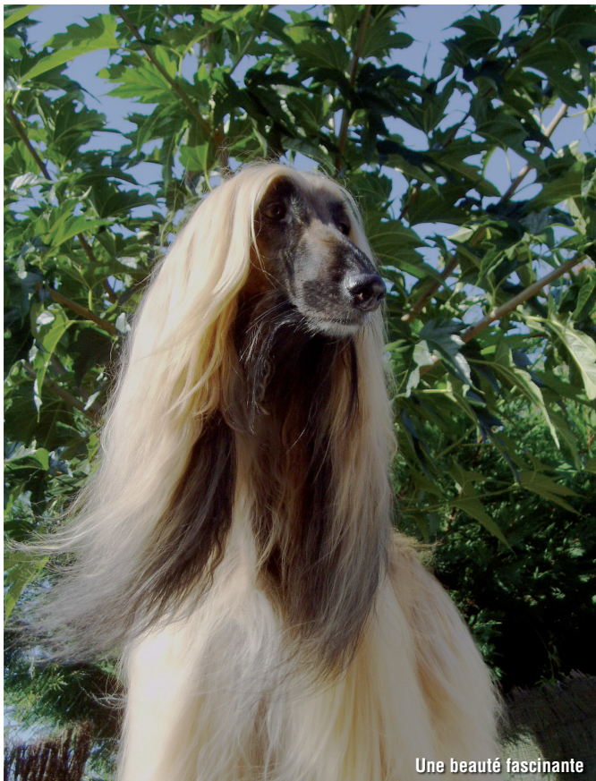
Une beauté fascinante